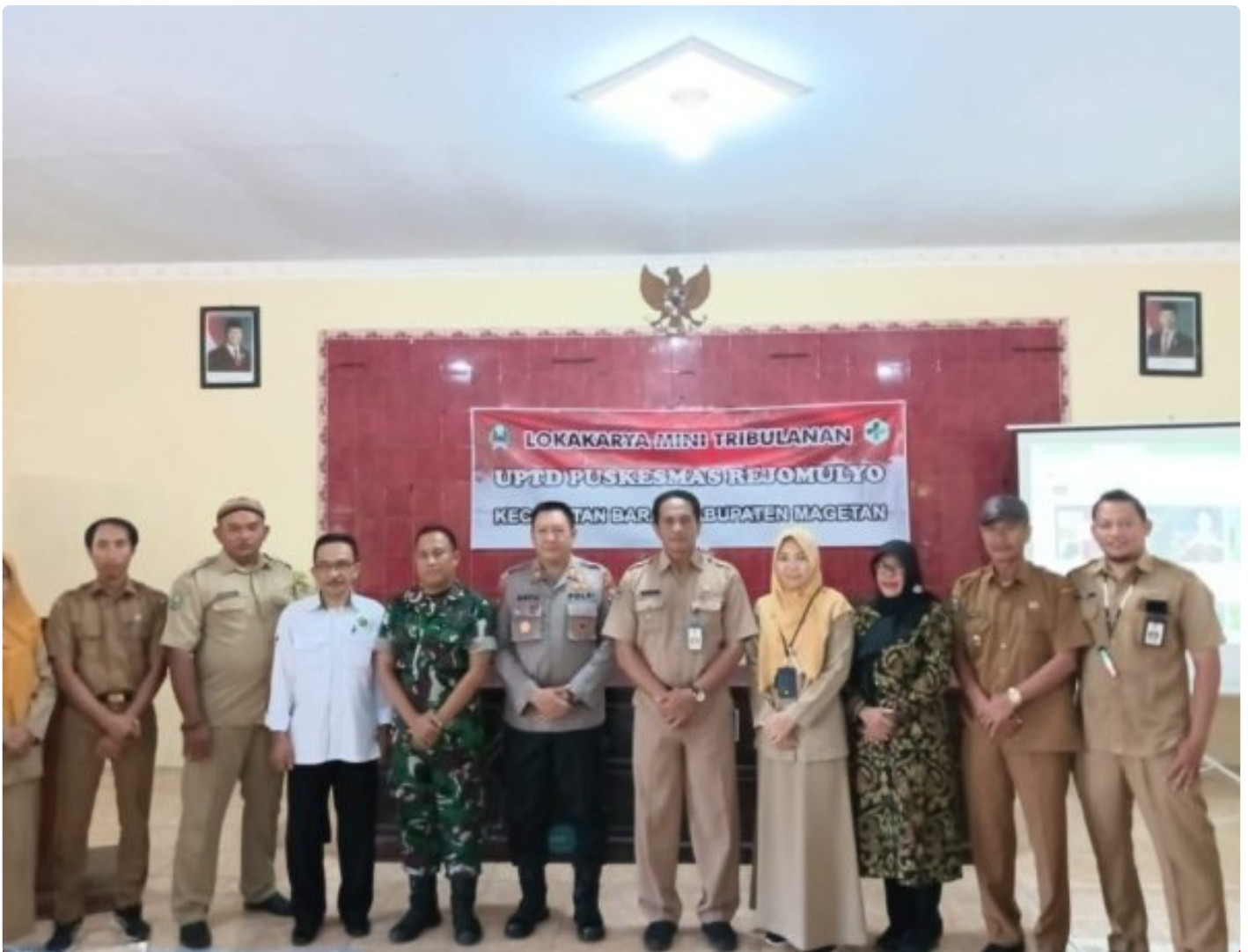
Danramil 0804/08 Barat Hadiri Lokakarya Mini Tribulan IV UPTD Puskesmas Rejomulyo